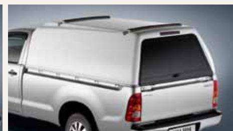
ZABUDOWA POLIESTROWA W WERSJI DOSTAWCZEJ