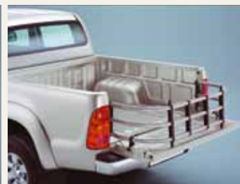
PRZEDŁUŻENIE PRZESTRZENI ŁADUNKOWEJ