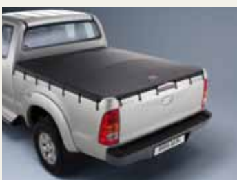
MIĘKKA OSŁONA PRZESTRZENI ŁADUNKOWEJ