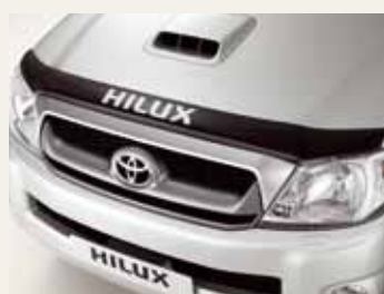
OWIEWKA NA MASKĘ