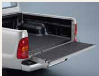
WYKŁADZINA PCV PRZESTRZENI ŁADUNKOWEJ