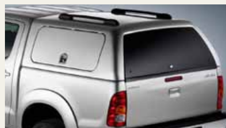
ZABUDOWA POLIESTROWA Z BOCZNYMI DRZWIČKAMI