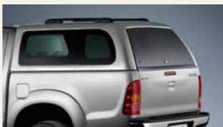
ZABUDOWA POLIESTROWA Z BOCZNYMI SZYBAMI