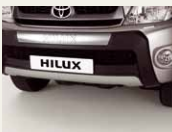
OSŁONA PRZEDNIEGO ZDERZAKA