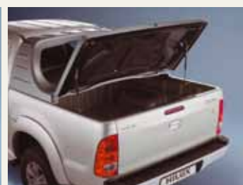
TWARDA OSŁONA PRZESTRZENI ŁADUNKOWEJ