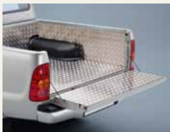
WYKŁADZINA ALUMINIOWA PRZESTRZENI ŁADUNKOWEJ