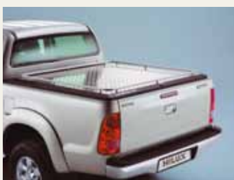
ALUMINIOWA OSŁONA PRZESTRZENI ŁADUNKOWEJ