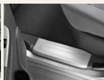
NAKŁADKI PROGOWE TYLNE