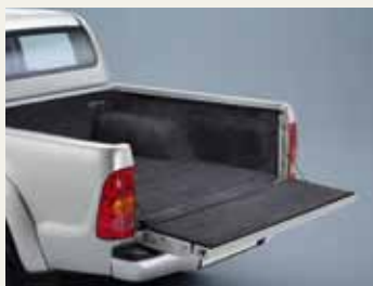
WYKŁADZINA WELUROWA PRZESTRZENI ŁADUNKOWEJ