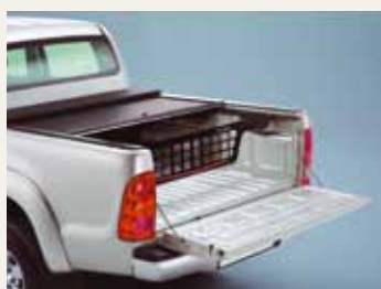
ROLETA Z OPCJONALNYM SYSTEMEM PODZIAŁU PRZESTRZENI ŁADUNKOWEJ