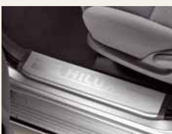
NAKŁADKI PROGOWE PRZEDNIE