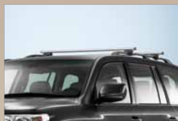
BAGAŻNIK DACHOWY NA RELINGI