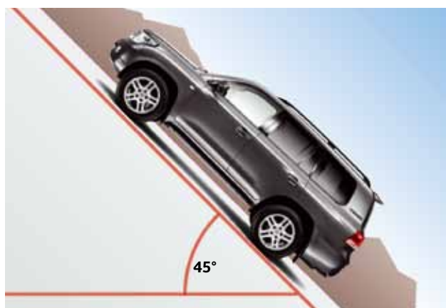
Zdolność pokonywania wzniesień 45°