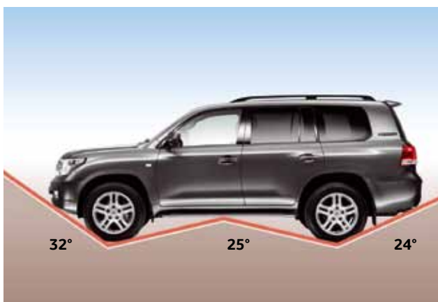
Kąt natarcia 32°, kąt zejścia 24° i kąt rampowy 25°