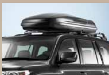
BOX BAGAŻOWY 390 L