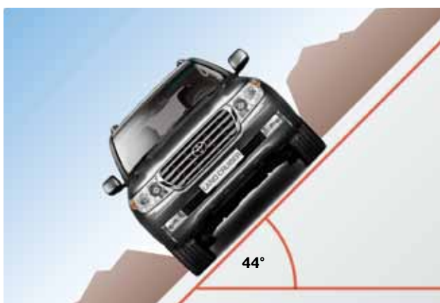
Maksymalny przechył boczny 44°