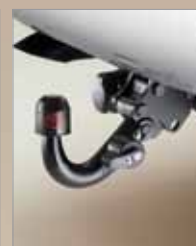
HAK HOLOWNICZY DEMONTOWANY